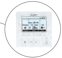
пульт PAR-41 MAR встроен в корпус блока