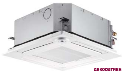
декоративная панель SLP-2FAL