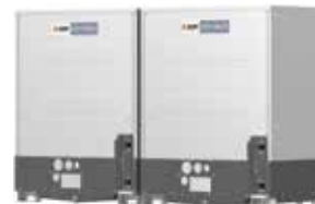
PQHY-P400YSLM-A1 PQHY-P450YSLM-A1 PQHY-P500YSLM-A1 PQHY-P550YSLM-A1 PQHY-P600YSLM-A1