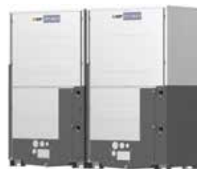
PQHY-P700YSLM-A1 PQHY-P750YSLM-A1 PQHY-P800YSLM-A1 PQHY-P850YSLM-A1 PQHY-P900YSLM-A1