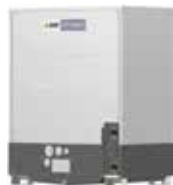
PQHY-P200YLM-A1 PQHY-P250YLM-A1 PQHY-P300YLM-A1